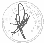
NIVEL DE SATISFACCIÓN