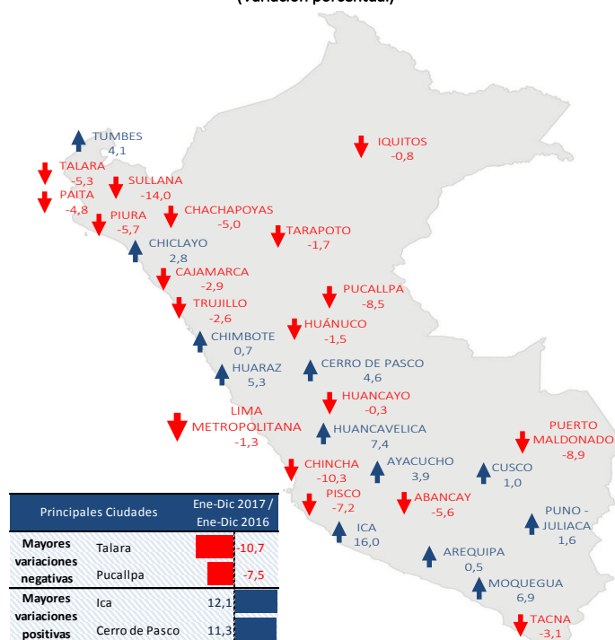
PERÚ URBANO: VARIACIÓN ANUAL Y PROMEDIO ANUAL DEL EMPLEO EN EMPRESAS PRIVADAS FORMALES DE 10 Y MÁS TRABAJADORES, SEGÚN CIUDADES, DICIEMBRE 2017 (Variación porcentual)

Nota: Cifras preliminares. La información corresponde al primer día de cada mes. Fuente: MTPE - Encuesta Nacional de Variación Mensual del Empleo (ENVME). Elaboración: MTPE - Dirección General de Promoción del Empleo (DGPE) - Dirección de Investigación Socio Económico Laboral (DISEL).