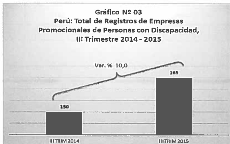
Gráfico N° 03 Perú: Total de Registros de Empresas Promocionales de Personas con Discapacidad, III Trimestre 2014 - 2015

Fuente: Informes de las Direcciones y Gerencias Regionales de Trabajo y Promoción del Empleo 2014/2015. Elaboración: Dirección de Promoción Laboral para Personas con Discapacidad – DGPE.