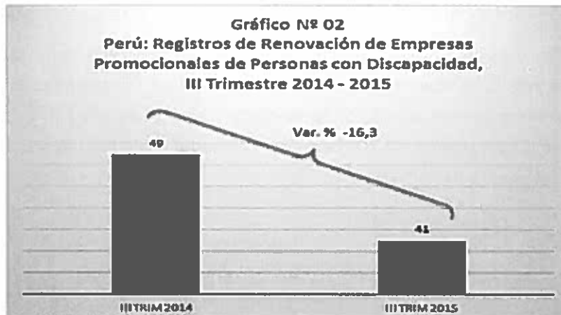
Gráfico N° 02 Perú: Registros de Renovación de Empresas Promocionales de Personas con Discapacidad, III Trimestre 2014 - 2015

Fuente: Informes de las Direcciones y Gerencias Regionales de Trabajo y Promoción del Empleo 2014/2015. Elaboración: Dirección de Promoción Laboral para Personas con Discapacidad – DGPE.